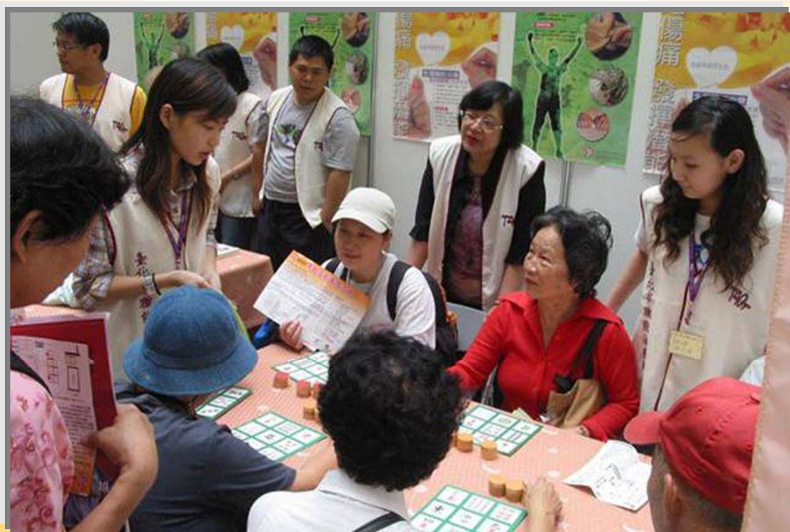
黃理事長(右3)率領理監事及幹事於臺北市政府失智症園遊會設攤， 一同致力宣傳職能治療專業