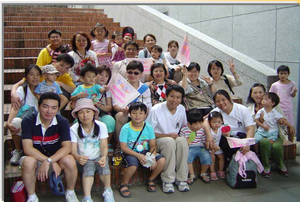
黃理事長(第二排右3)舉辦臺北市職能治療師公會聯誼活動， 於黃金博物館一同與會員和家人合影留念