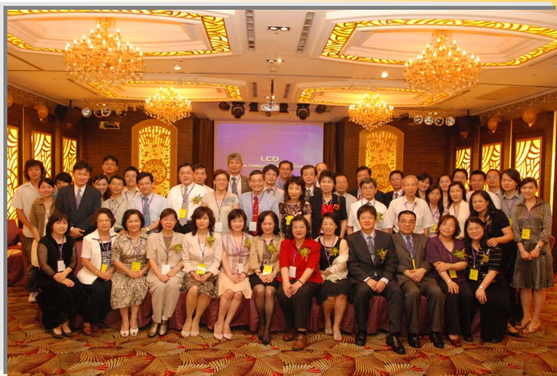
2007 黃理事長(前右六)與臺北市十一大醫事團體理事長暨理監事合影