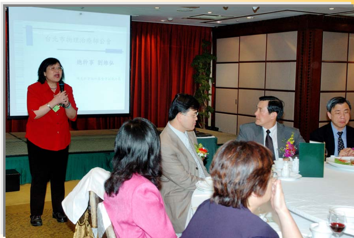
2007 黃理事長於臺北市十一大醫事團體聯合餐敘會， 向馬英九市長及宋晏仁衛生局長宣揚職能治療專業理念及精神