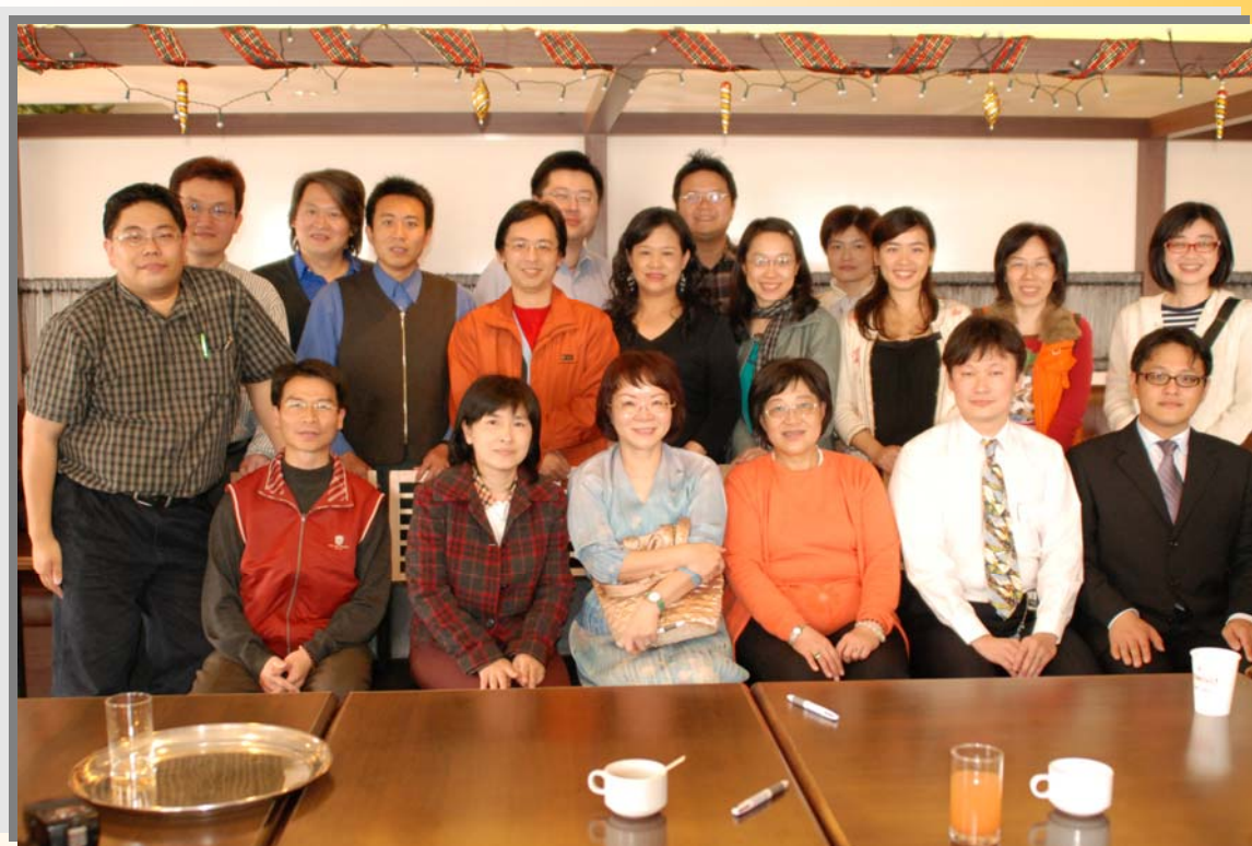
黃理事長(前右3)召開第四屆第一次會員大會暨理監事會改選， 與新任理監事合影留念